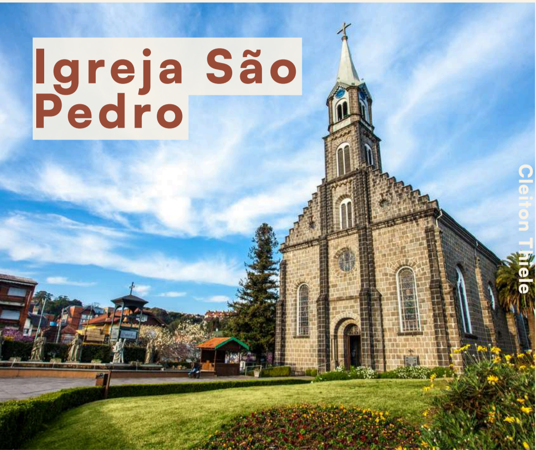
Igreja São Pedro