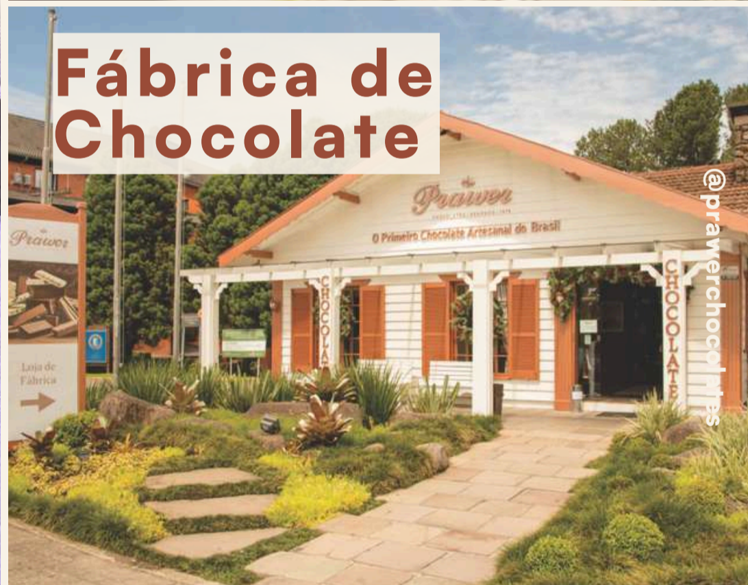
Fábrica de Chocolate

Pela manhã, divirtam-se no Snowland, o maior parque indoor de neve do Brasil. À tarde, encantem-se com as réplicas do Mini Mundo e, para fechar o dia, aproveitem para se deliciar em uma das chocolaterias mais tradicionais da cidade.